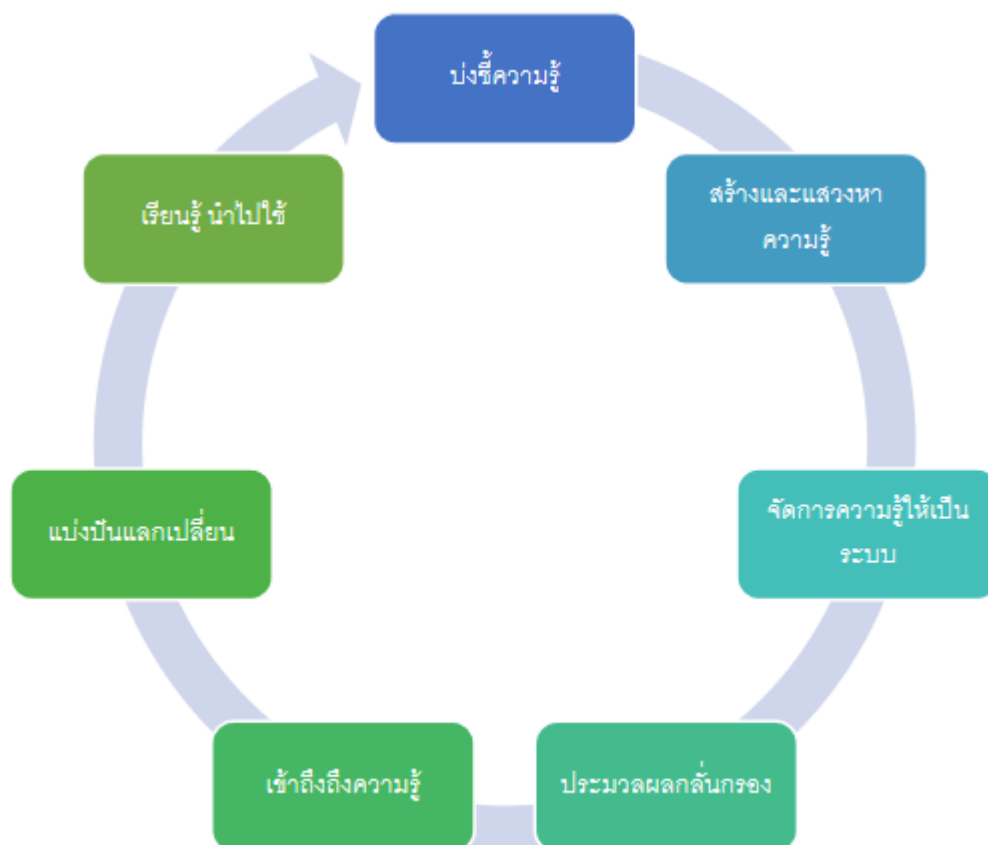
กระบวนการ 7 ขั้นตอน ของ KM

๗) การเรียนรู้ - ควรทำให้การเรียนรู้เป็นส่วนหนึ่งของงาน เช่น เกิดระบบการเรียนรู้จากสร้างองค์ความรู้ นำความรู้ไปใช้ในการปฏิบัติงานจริง เกิดการเรียนรู้และประสบการณ์ใหม่ และหมุนเวียนต่อไปอย่างต่อเนื่อง (คู่มือ กพร) หากการทำ KM ที่ได้ไปเรียนรู้ ไปใช้งานจริงแล้วไม่ได้ผล ให้ย้อนกลับไปทำเรื่องใหม่ หรือทบทวนความผิดพลาดในแต่ละขั้นตอน